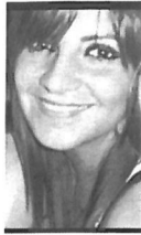
TITOLO DI STUDIO

📍 Via Tasso 70, 70042 Mola di Bari (Italia)